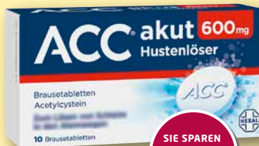
ACC® akut 600 10 Brausetabletten

Achten Sie auf weitere Angebote in unserer Apotheke!