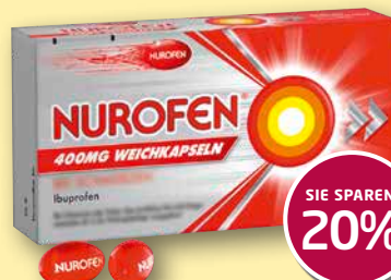
Nurofen® 400 mg Weichkapseln 20 Stück