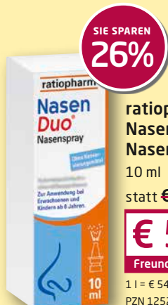
ratiopharm NasenDuo® Nasenspray 10 ml