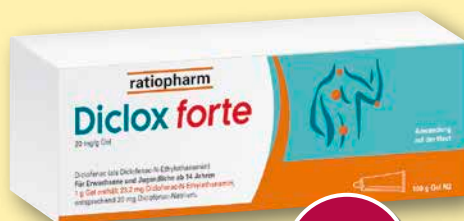
Diclox forte 20 mg/g Gel 100 g