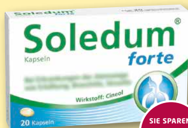
Soledum® Kapseln forte