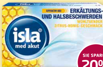
isla® med akut Zitrus-Honig-Geschmack 20 Halspastillen