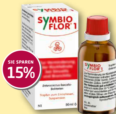
Symbioflor® 1 Suspension 50 ml

Es ist Januar. Es ist kalt. Es ist nass. Erkältungszeit. In gleich drei Beiträgen in diesem Heft erfahren Sie, wie Sie sich am besten schützen und wie Sie mit Erkältungssymptomen optimal umgehen. Dazu wie immer praktische Gesundheitstipps und interessante News aus Wissenschaft und Forschung.